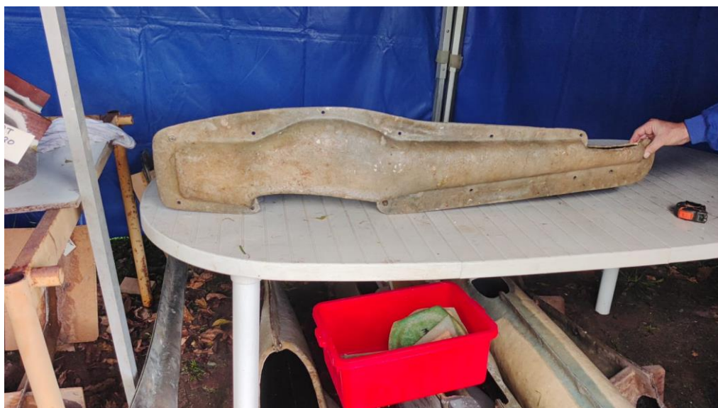
31 – PETIT BISON 1m80 – 50€