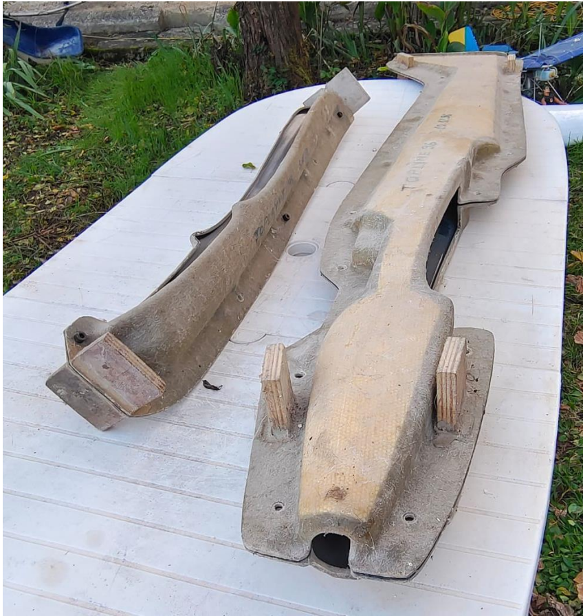
9- P47 2m60 + capot+ dessous + train atterrissage – 400€