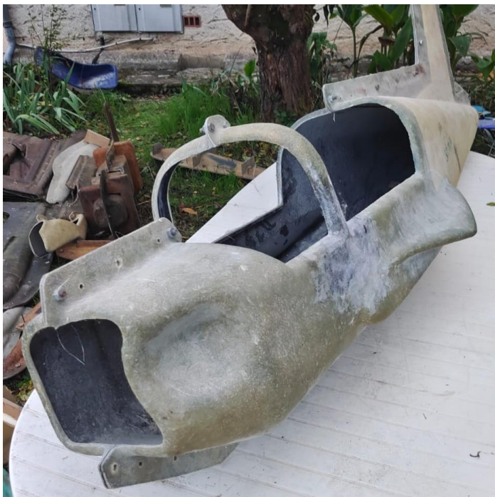
14- QUAZARD – 150€